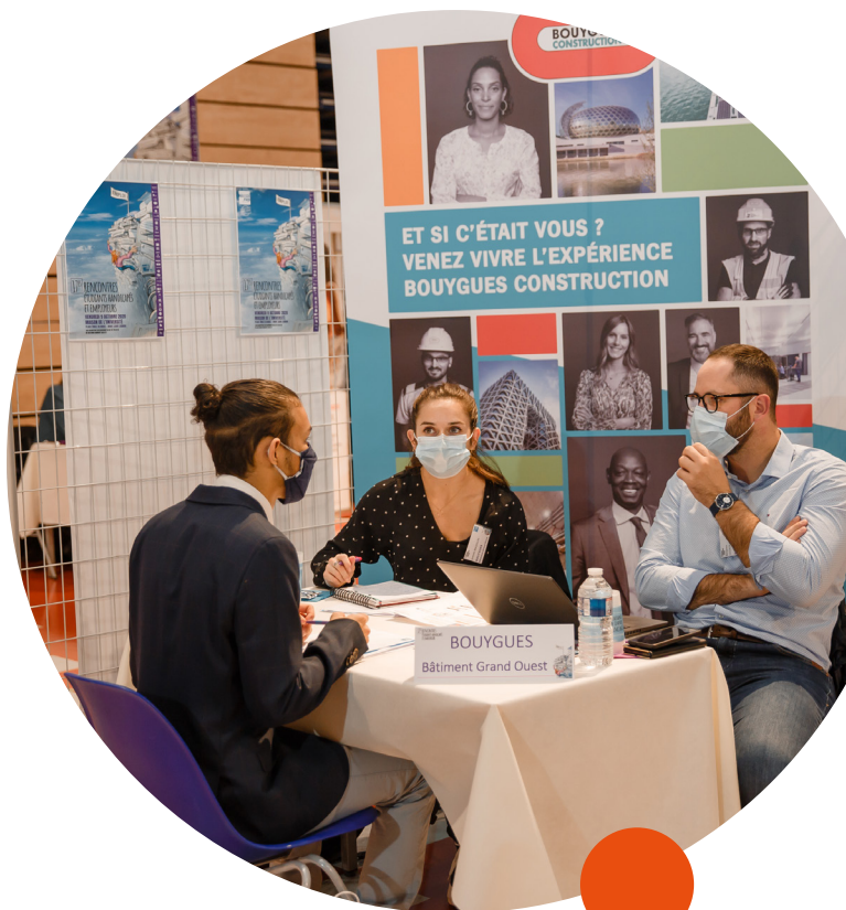
Stand Bouygues Bâtiment Grand Ouest au Forum Handisup

Parmi celles-ci, notons la création en janvier 2021 des Handi News à destination des collaborateurs, le partage d'expériences avec d'autres entreprises engagées à travers le club inter-entreprises "Cultivons la diversité", la participation à la SEEPH (Semaine Européenne pour l'Emploi des Personnes Handicapées) ainsi que des conférences et tables rondes afin de partager engagements et méthodes (INSA Rouen, ESSEC). Bouygues Bâtiment Grand Ouest est en outre partenaire d'Handisup depuis plus de 10 ans. Cette structure œuvre à l'inclusion des étudiants en situation de handicap. Ce partenariat vise ainsi à permettre à des personnes en situation de handicap de découvrir les métiers de la construction, et, pour l'entreprise, à recruter et favoriser l'emploi direct.